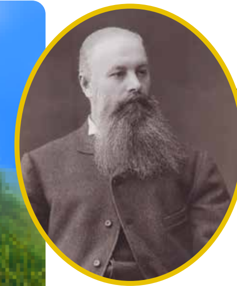
Василь Васильович Докучаєв