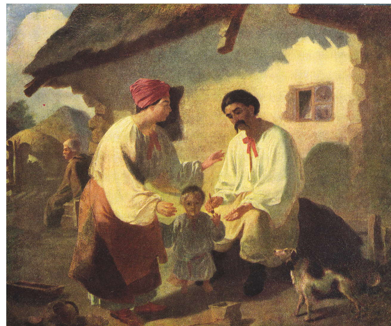
Тарас Шевченко. Селянська родина