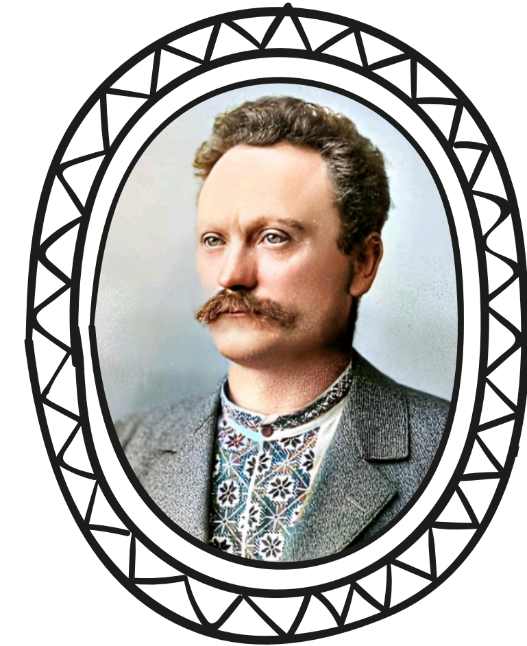
ІВАН ФРАНКО (1856 – 1916)

РЕФРЕН: «Розвивайся ти, високий дубе, / Весна красна буде!».